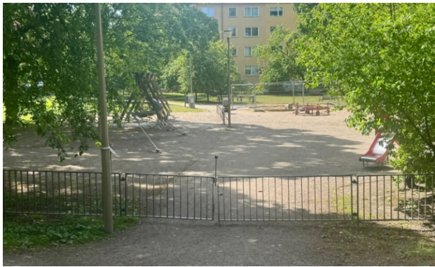
Botvidsparkens lekplats (2025)